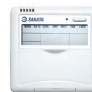
SAR-24 (в комплекте)