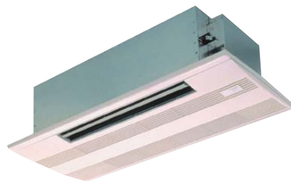
декоративная панель PMP-40BM