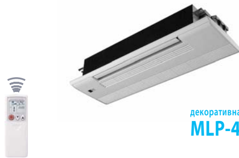
декоративная панель MLP-440W